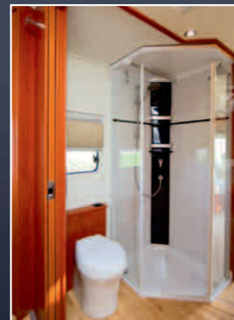
Große Dusche mit solider Wanne und Echtglas-Abtrennung.

Info: Telefon 0 95 52/93 06 10, www.morelo-reisemobile.de