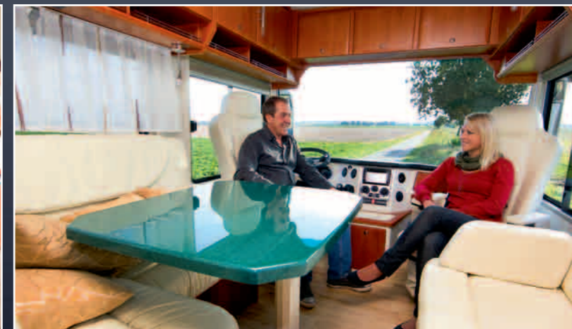
Alternativ zu dem kühlen Mineralwerkstofftisch gibt es wohnlichere Dekors. Auf Wunsch weichen die Bugschränke auch einem Hubbett.

theker-Auszug sind Serie. Der Espressoautomat kostet allerdings Aufpreis. Ebenso Lederbezüge für die gastfreundliche Sitzgruppe.