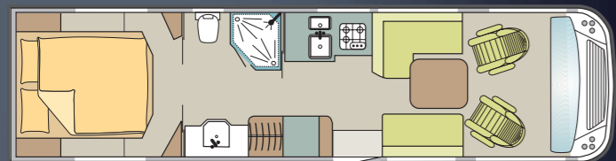
Die Palace-Modelle unterscheiden sich vor allem in der Schlafraumgestaltung. Die drei größten haben unterm Bett eine Pkw-Garage.

Das generöse Platzangebot im vorgestellten 90 M kommt also bestens zur Geltung. Im Schlafzimmer im Heck breitet sich ein großes Queensbett aus. Das Raumbad davor teilen sich Waschtisch und Dusche im King-Size-Format. Die Toilette steht frei im Raum – Geschmacksache. Die Küche setzt das Verwöhnprogramm fort: Mineralwerkstoff-Arbeitsplatte, Grill-Kühlschrank-Kombination und der deckenhohe Apo-