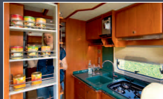
Die zwei Spülen sind in die Arbeitsplatte eingegossen. Platz für Vorräte im Apothekerauszug.