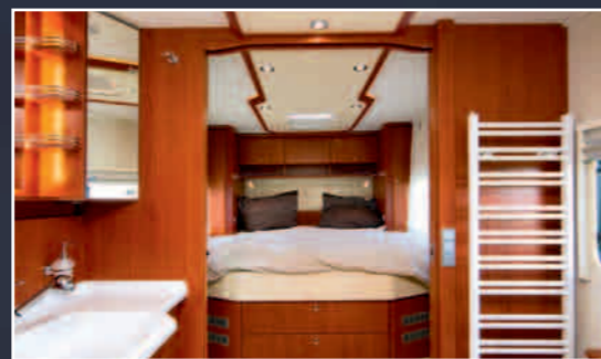
Ein Leuchtenbaldachin zieht sich an der Decke entlang bis ins große Schlafzimmer im Heck.